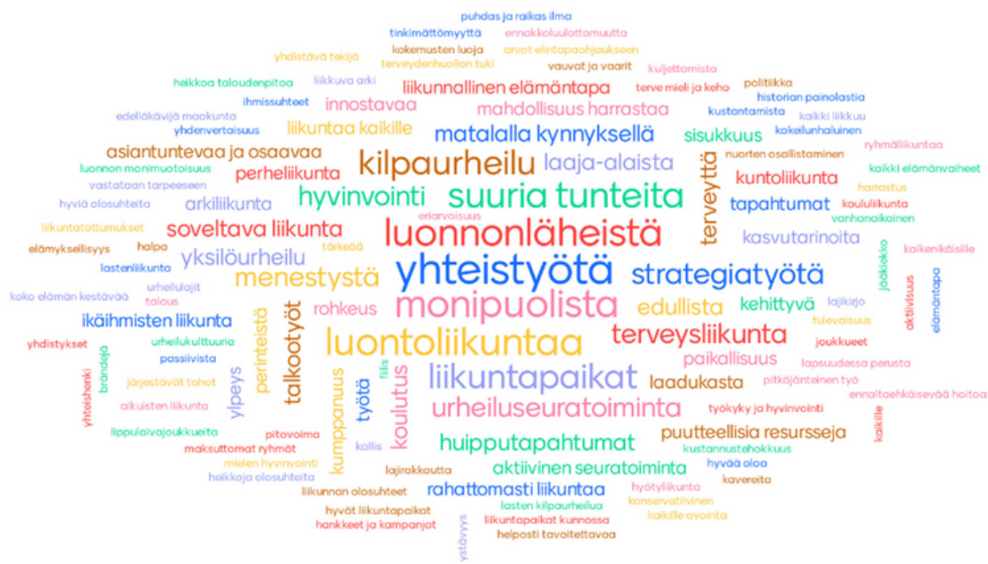
Kuvio 1: Satakuntalaisen liikunnan keskeisiä arvoja ja sisältöjä. Mentimeter-kooste 12.4. tilaisuuteen osallistuneiden vastauksista.

Liikunnallisen elämäntavan tukemista viestinnän, tiedolla johtamisen ja osaamisen vahvistamisen kautta.