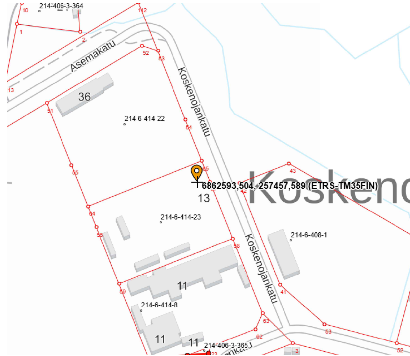
1:1000 / Asemapiirros / Kankaanpään kaupungin numeerinen aineisto (kantakartta).